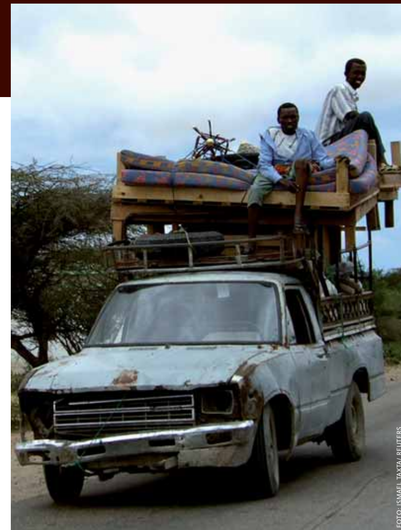
Inwoners ontvluchten Mogadishu in september 2007, uit angst dat hun kinderen geronseld worden voor de strijd tussen rivaliserende partijen.

land wordt expliciet bepaald door het verspreidingsgebied van de Harti, een subclan van de Darod. Dit leidt tot een conflict met Somaliland over Sool en Sanaag. Puntland claimt dit gebied omdat er veel Harti wonen.