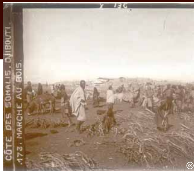
Links: Frans Somaliland (het huidige Djibouti) is een van de ontbrekende stukken in de legpuzzel van een Groot Somalië. Onder: De staatsgreep onder leiding van Siyad Barre in 1969 wordt als vreedzaam aangeprezen en lijkt een Groot Somalië dichterbij te brengen.